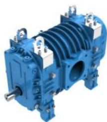
Pompa a lobi Lobe pump

Pompa a lobi alimentata da un motore Diesel di ultima generazione Euro Stage V.